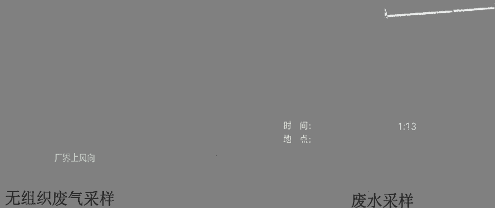
附图 1: 现场采样照片